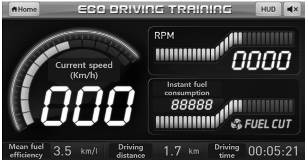
Fig. 1. Eco in-vehicle information system used in this study.

에 대한 정보도 함께 제공 받는 것으로 정의 되었다. RPM은 1분 당 엔진의 회전 수를 나타내며 over RPM은 2800 RPM 이상으로 정의하였다.