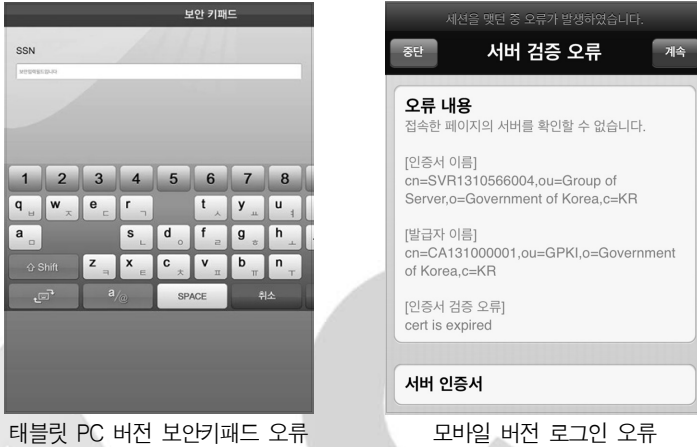
태블릿 PC 버전 보안키패드 오류