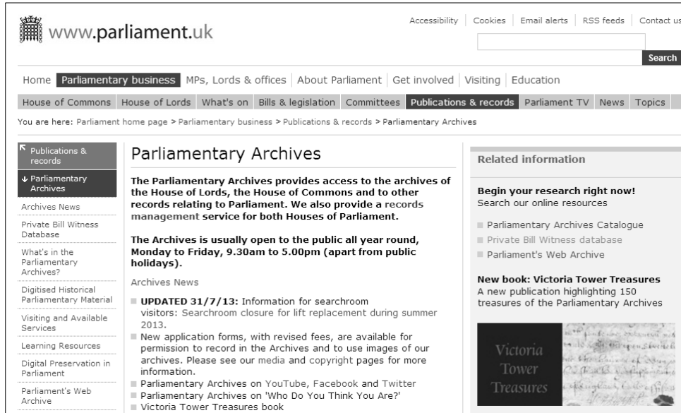
〈그림 2〉 영국 의회 아카이브

(〈http://www.parliament.uk/business/publications/parliamentary-archives/〉 [검색일 2013.10.5])