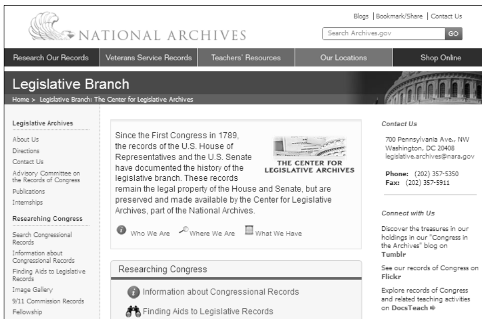
<그림 1> 미국 입법 아카이브 센터 (<http://http://www.archives.gov/legislative/> [검색일 2013.10.5])

CLA의 웹사이트는 3개의 카테고리로 나누어져 있으며, 각각 4~5개의 하위 카테고리로 구성되어 있다. '입법 아카이브(Legislative Archives)'는 기관에 대한 설명과 위치, 방문안내, 출판물 소개 등을 포함하고 있으며, '의회 탐구(Researching Congress)'는 기관에서 소장하고 있는 기록물 컬렉션에 대한 설명과 함께 검색 도구, 이미지 갤러리를 통하여 주로 기록을 검색하고 활용할 수 있도록 한다. 또한 9.11테러 위원회와 관련된 특별한 컬렉션과 학술지원 프로그램에 관한 안내도 포함되어 있다. 마지막 카테고리인 '자료(Resources)'는 대의민주주의와 미국 의회제도에 대한 교육용 콘텐츠와 기타 의회 컬렉션 및 특별 문서를 포함한 주제별 컬렉션 등 CLA에서 자체적으로 제작·가공한 서비