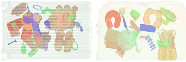
Fig. 4. Simulated Screening Task Image(left: gun, right: knife)

수화물 검사에서 탐지해야 할 위험 물품은 매우 다양하지만 본 연구에서는 기존 선행연구들에서 많이 사용되어왔고, 위험도가 큰 칼, 총으로 2가지 물품을 선정하였다(Fig. 4 참조). 각 물품은 유사한 형태로 2가지 이미지로 제작되었으며 참가자들은 총 4가지 이미지를 위험 물품으로 적발해내야 했다.