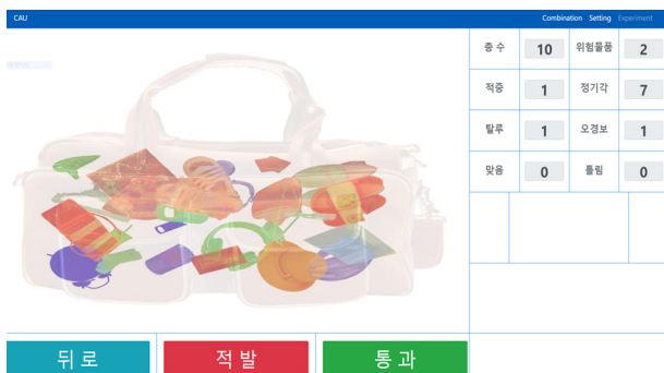
Fig. 5. Image of providing information feedback.

종속변인은 적중(hit), 탈루(miss), 오경보(false alarm), 정기간(correct rejection) 비율, 수행시간(performing time)이었다. 적중은 위험 물품이 존재할 때 참가자가 위험 물품이 존재한다고 결정한 비율, 탈루는 위험 물품이 존재할 때 참가자가 위험 물품이 없다고 결정한 비율, 오경보는 위험 물품이 없을 때 참가자가 위험 물품이 존재한다고 결정한 비율, 정기간은 위험 물품이 없을 때 참가자가 위험 물품이 없다고 결정한 비율로, 수행 시간은 과제시작부터 종료 때까지의 시간으로 정의하였다(Table 1 참조). 적중과 탈루의 합 그리고 오경보와 정기간의 합은 100%이다.