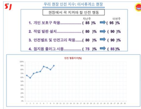
그림 1. 두 현장(좌: S철강, 우: S 건설)에 부착된 피드백 판

피드백 제공을 위해서 현장에 있는 상황실(S 건설), 혹은 현장 내 직원들이 잘 볼 수 있는 공간(S 철강)에 피드백 판을 제작하여 부착하였다. 그림 1에는 두 현장에서 제작된 피드백 판의 모습이 제시되어있다. 피드백은 현장 책임자가 2주 1회 모든 근로자들을 대상으로 시행하였다. 피드백 판 안에는 행동 체크리스트에 있는 근로자 안전 행동에 대한 내용이 포함되었다. 피드백 판의 윗부분에는 각 행동에 대한 지난 2주와 최근 2주의 안전행동 비율을 비교할 수 있는 내용이 제시되었고, 아래 부분에는 지금까지의 전체 항목들의 안전행동 평균 비율의 패턴을 알 수 있도록 각 회기별 안전행동 비율을 그래프로 제시하였다.