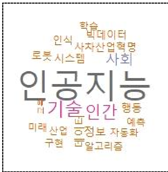
그림 2. 인공지능분야 워드클라우드분석 Fig. 2. Word Cloud Result of Article Data