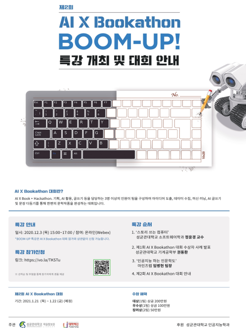
<그림 1> 제2회 AI x Bookathon 특강 포스터

내 AI 관련 전공 교수와 교외 AI 전문가를 초빙하여 특강을 진행해 프로그램 수강자들이 AI와 관련된 역량 즉 AI 리터러시를 함양할 수 있도록 도왔다. 둘째, 지속적으로 프로그램을 진행하는 과정에서 참여 대상을 A 대학 재학생에서 전국 대학교 재학생으로 확대 운영하여, 교육 제공의 폭을 증대시켰다.