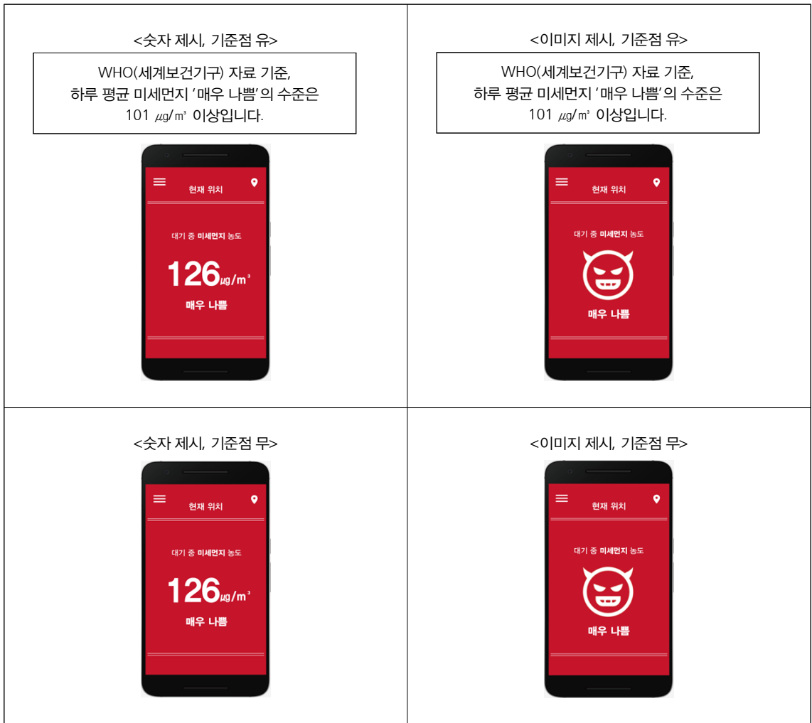
Figure 1. Message Stimuli

사는 일반인 100명을 대상으로 온라인을 통해 실시하였는데, '매우 나쁨'에 해당하는 이미지(이모티콘)와 미세먼지 농도를 알려주는 기준점 정보 "WHO(세계보건기구) 자료 기준, 하루 평균 미세먼지 '매우 나쁨'의 수준은 101 \mu\text{g}/\text{m}^3 이상입니다"의 내용이 모두 포함된 실험 자극물 화면을 제시한