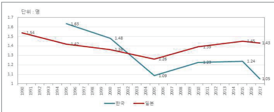
<그림2> 한일양국의 합계특수출산율 장기추이

특수)은 2005년(1.26명)을 최저점으로 점차 상승세를 보이며 2001년 한국(1.31명)과 역전(1.33명)되며 출산저지에 적어나마 브레이크가 걸린 걸로 확인된다(<그림2> 참조). 특히 아베정권 개시이후 출산율은 조금씩 상향추세 중인데 여러 이유가 있겠으나, 경기회복과 맞물린 불확실성의 제거 및 출산환경 개선 등도 영향을 미쳤을 걸로 판단된다. 이는 2014년 소멸리스트 발표이후 급격히 높아진 소멸위기와 그 대응책으로서 2.0의 2번째(희망출산율 1.8명), 3번째 화살(간병퇴직 제로)을 둘러싼 실효기대도 한몫했을 수 있다. 간접적이고 개념적인 1.0의 화살 3개보다는 2.0의 출산·WLB(양립조화) 등의 생활단어가 미래세대에 먹혀들었을 가능성이 다. 때문에 자연증감과 함께 사회증감에 주목함으로써 공식추계보다 인구감소가 더 빨라질 수 있다는 소멸리스트의 위기경고는 2.0의 정책세트에 인구문제를 반영하는 기축제였을 수 있다.