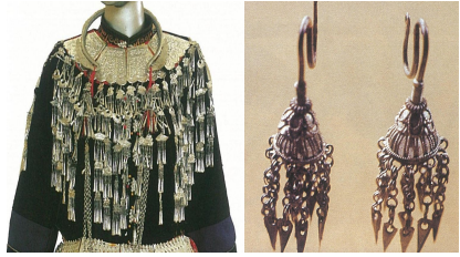
<그림 14> 좡족 귀걸이, 목걸이, 팔찌 (출처: 中国编织服饰大全6 (p.395,400) 류정. 2005, 텐진: 천진인민출판사.)