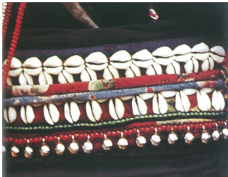
<그림 24> 하니족 벨트