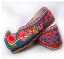
<그림 20> 다이족 신발