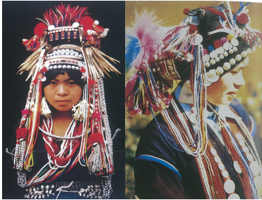
<그림 27> 하니족 여성 두식