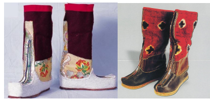
<그림 21> 좡족 부츠