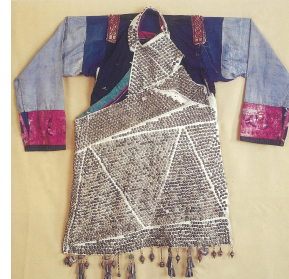
<그림 3> 평투(平头) 좡족 명절 여성복식