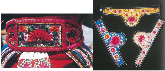
<그림 22> 바이족 벨트 (출처: 中国编织服饰大全6 (p.294) 류정, 2005, 텐진: 천진인민출판사.)