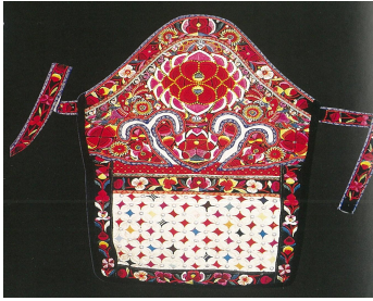
<그림 30> 바이족 꽃자수 문양 벨트장식