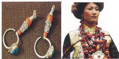
<그림 16> 좡족 귀걸이, 목걸이, 팔찌