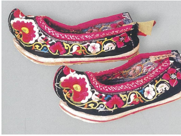
<그림 31> 바이족 자수 신발