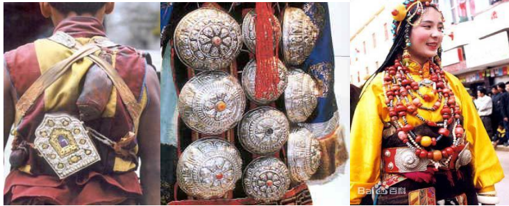
<그림 33> 종교적 의미가 담긴 장족의 복식

를 제작할 때 자연생물 모양의 도안을 많이 착용하여 자연 경치를 복식위에 수를 놓아 표현하기도 하며(그림 29, 30), 자연물에서 직접 채집하여 장신구에 활용하기도 한다(그림 31). 모자에는 다양한 색상을 쓰고 주로 빨간색을 이용해서 열정적인 느낌을 표현한다. 자연물 중에서 꽃문양을 복식이나 장신구에서 많이 사용하는데 특히, 모자에 여러 꽃문양의 자수로 수놓는다.