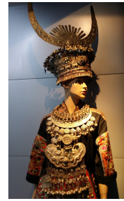
<그림 29> 상해 미술관