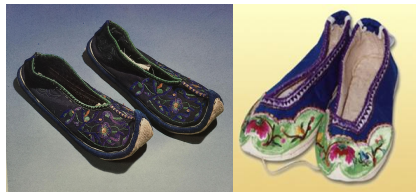
<그림 18> 좡족 여성 신발