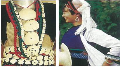
<그림 13> 바이족 귀걸이, 목걸이, 팔찌