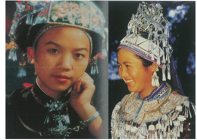
<그림 9> 좡족 여성 두식