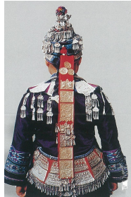
<그림 2> 진동남(滇东南) 좡족 명절 복식