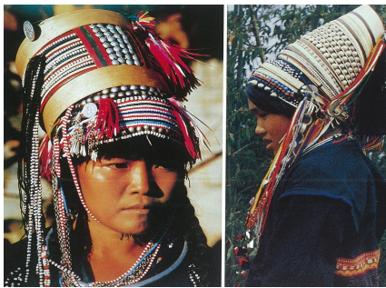
<그림 10> 하니족 여성 두식