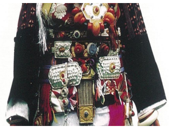
<그림 26> 좡족 벨트 장식

현된다(그림 18). 다이족 여성들은 여성스러운 느낌을 표현하며 밝고 선명한 색을 주로 이용한다. 문양은 꽃, 문하무늬 등을 자수로 수놓고 면사와 실크사를 사용하거나 금사를 사용하여 다이족 고유의 특징을 표현한다(그림 19)(李昆生, 周文林, 2002). 고원 지역에서 거주하며 주로 빨간색을 애용하는 장족은 모직물인 방로 또는 가죽을 이용하여(박선영, 2004) 신발을 높고 따뜻하게 만든다(그림 20).