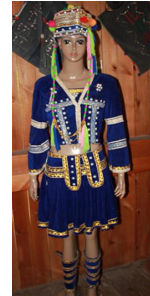
<그림 6> 하니족 여성복식

다양한 종류의 호박, 송이석 등을 꿰어 만든다. 장족 여자들은 결혼이나 명절의 복식과 장식을 통해 자신의 집안과 신분을 나타낸다(그림 5)(소황옥, 김양희, 2008).