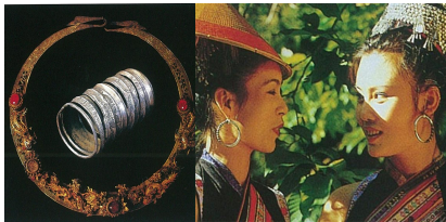
<그림 15> 다이족 귀걸이, 목걸이, 팔찌 (출처: 운남소수민족복식 (p.133) 이문생, 주문림. (2002), 큰명: 운남미술출판사.)