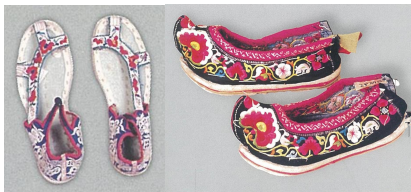
<그림 17> 바이족 자수 신발 (출처: 中国编织服饰大全6 (p.292) 류정. 2005, 텐진: 천진인민출판사.)