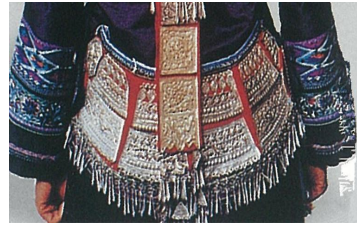
<그림 23> 좡족 벨트