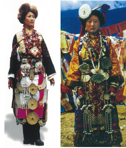
<그림 5> 장족 여성 복식 (출처: 中国编织服饰大全6 (p.428) 류정, 2005, 텐진: 천진인민출판사.)