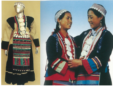
<그림 1> 란평(澜平) 바이족 여성 복식