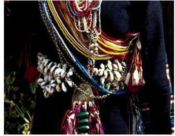
<그림 32> 하니족 벨트