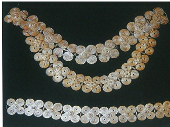
<그림 25> 다이족 은 벨트 (출처: 中国编织服饰大全6 (p.446) 류정, 2005, 텐진: 천진인민출판사.)