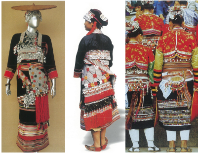
<그림 4> 신평(新平) 다이족 여성 복식