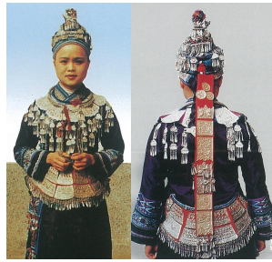
<그림 28> 좡족 명절 복식 (출처: 中国编织服饰大全6 (p.394) 류정, 2005, 텐진: 천진인민출판사.)