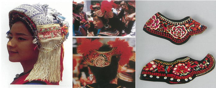
<그림 8> 바이족 여성 두식 (출처: 中国编织服饰大全6 (p.283-288) 류정, 2005, 텐진: 천진인민출판사.)