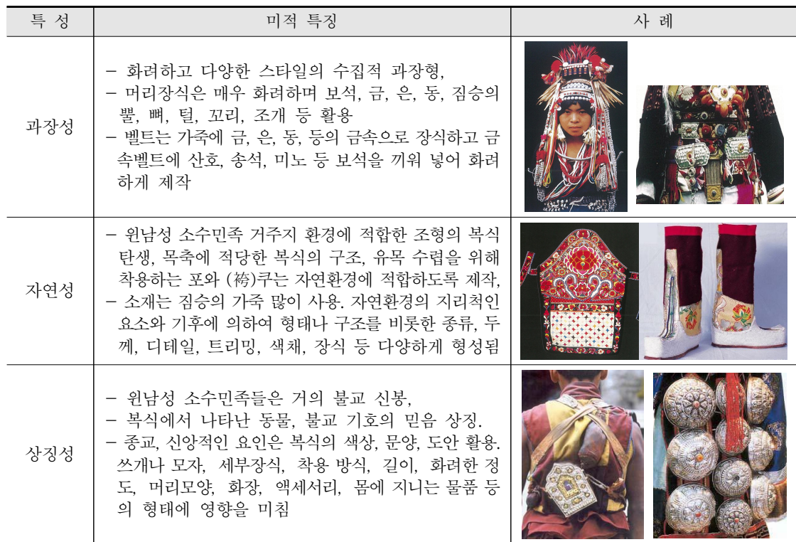
<표 2> 중국 소수민족 복식 장신구의 미적 특성