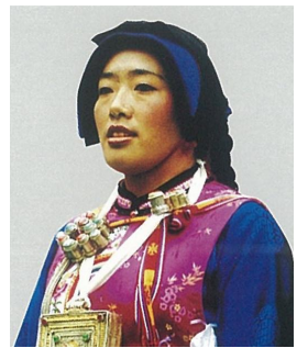
<그림 12> 좡족 여성 두식 (출처: 中国编织服饰大全6 (p.433) 류정, 2005, 텐진: 천진인민출판사.)

는 술잎 같은 장식으로 착용하고 자수 두건도 많이 사용된다(그림 8). 하니족 여성들은 머리에 두식은 은포를 많이 착용해서 명절 때에는 천이나 여러 색상으로 된 깃털도 많이 착용한다. 여성들은 통두건을 되어 있고 두건위에 은장식을 화려하게 장식한다(그림 9). 다이족 여성들은 머리를 올려서 꽃이나 빛을 쬐기를 좋아하고(김일정, 2002) 자수를 놓은 수건이나 은포 장식 그리고 동그란 밀짚모자를 착용한다. 부녀자들은 통모자를 착용한다(그림 10). 윈남성에 거주하고 있는 장족의 여성들은 두건으로 모자형태를 만들고 또는 가죽 털을 이용해 만든 모자로 머리장식을 한다. 장족들은 해발이 높은 지역에서 거주하기 때문에 날씨가 추워서 따뜻한 재료를 사용해야 하기 때문이다(그림 11)(李昆生, 周文林, 2002).