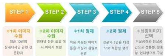
<그림 1> 단계별 이미지 수집 및 정제과정

수집된 이미지 자료들은 다음과 같은 정제과정을 거쳤다. 1차적으로 실내디자인특성 중 인테리어 디자인, 가구 디자인, 색채 및 마감재, 전망과 조경, 조명 4) 기반으로 한옥형 호텔 객실공간에 적용 가능한 이미지들을 거실과 침실로 분류하였다. 이와 같이 정제된 이미지들은 전문가 5인 5) (실내디자인 관련교수, 실내디자인)을 대상으로 적합성 여부를 평가하여 3인 이상 적합 판정을 받은 이미지를 선택 사용하였다(그림 1 참조).