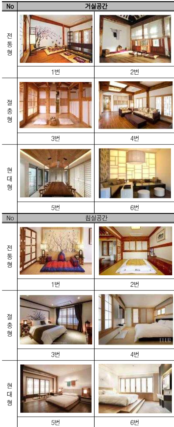
〈표 1〉 객실공간 선호이미지

성 적용 정도에 따라서 공간마다 전통형 2개, 절충형 2개, 현대형 2개로 구분하였다. 전통형, 절충형, 현대형에 선택된 각 2개의 이미지는 번호로 표기하였는데 각 항목 중 홀수번호에 해당되는 이미지는 그 중에서도 전통적 스타일이 강조된 것이고 짝수번호는 현대적 스타일이 강조된 것으로 조사자들에게는 이미지와 번호만 표기하여 제시하였다(표 1 참조).