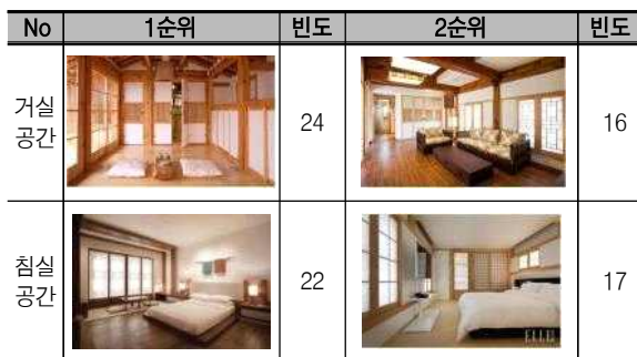
〈표 3〉 객실공간에 대한 전반적 선호이미지

반면에 침실공간은 거실공간과는 달리 1순위에서는 현대형 5번, 2순위는 절충형 4번으로 조사되었는데 침대를 기준으로 바닥, 벽, 그리고 가구 배치에 대한 차이가 나타났다(표 3 참조).