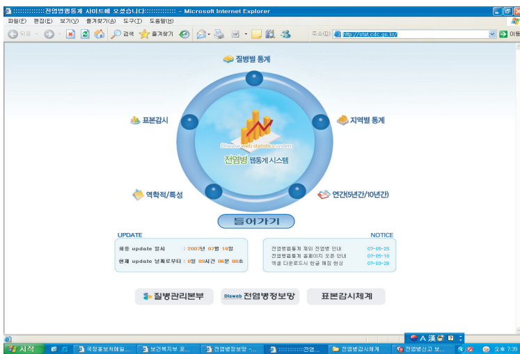
Figure 2. Initial page of web-based statistical program for communicable diseases. ( http://stat.cdc.go.kr )

통하여 수집된 자료는 각종 주보, 월보, 연보, 보도자료 등의 환류자료로 작성하여 전염병정보망( http://dis.cdc.go.kr )을 통하여 모든 국민에게 제공되고 있다.