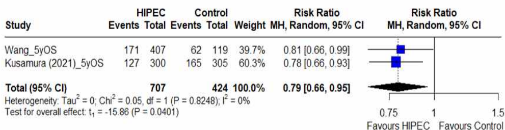
그림 3.4 [NRS] 5년 전체생존율

CI, confidence interval; CRS, cytoreductive surgery; HR, hazard ratio; OS, overall survival